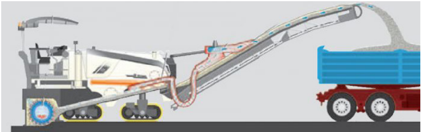
Die Fräsrolle der W 100 F/K ist am Heck angeordnet, Ausstattung der Maschine mit integrierter Absaugung zur Staubreduzierung.

Die vielseitig einsetzbaren Kleinfräsen können das Fräsgut komplett oder teilweise über ein integriertes Ladeband an Lkw oder Radlader abgeben. Alternativ kann das granuliert Material in der Frässpur verbleiben. In diesem Fall können vorbereitete Gräben befahren werden, bis die nachfolgenden Arbeiten beginnen.