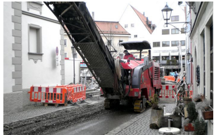
Prinzipische der Arbeitsweise von Kleinfräsen: Fräsrolle hinten rechts und Höhensteuerung über die Fahrwerke.